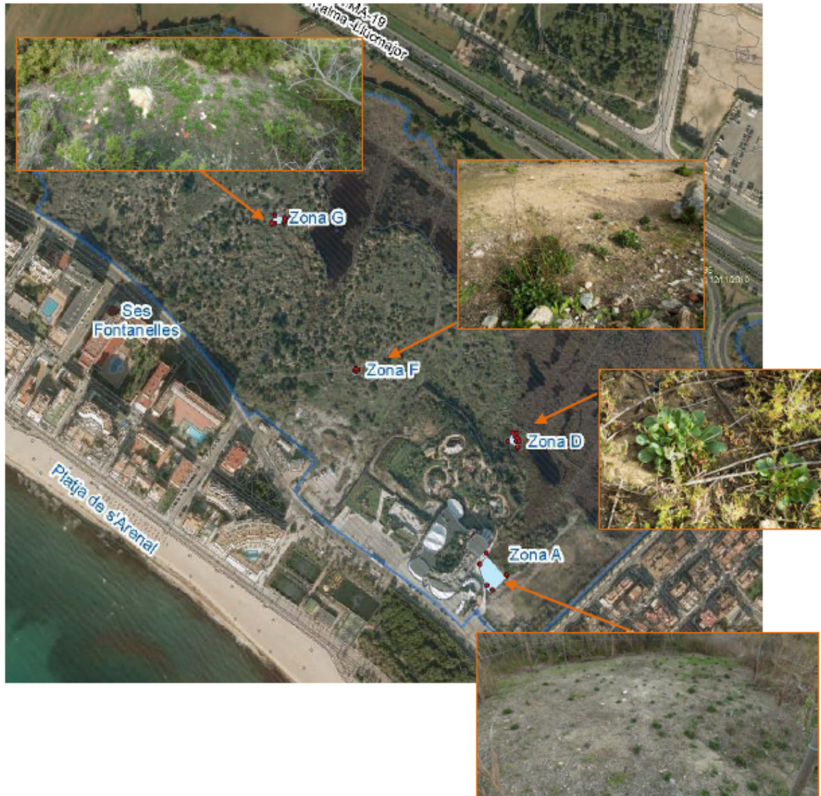
Figura 7. Zonas con presencia identificada de Limonium barceloi

A Ses Fontanelles la darrera dècada s'han catalogat més de 110 espècies d'ocells , moltes d'elles d'interès internacional de conservació.