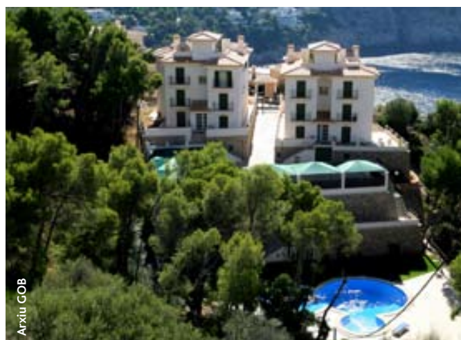
Apartaments il·legals a Cala Llamp (Andratx)

Paral·lelament als recursos contenciosos, el GOB ha utilitzat la via penal per a la defensa del medi ambient i dels recursos naturals. Tot i que fins al 1996 el Codi penal només tenia en compte els delictes contra el medi ambient de forma esquifida, el GOB havia interposat denúncies o querelles tant davant els jutjats de guàrdia com especialment davant la Fiscalia de Medi Ambient. Maldament només poguéssim usar la denúncia per abocaments, el GOB va presentar davant els jutjats i la Fiscalia casos com l'abocament d'aigua bruta sense depurar a Andratx (1984) i a s'Albufera (1988), o la regeneració de platges (1988) i arrasament de zones humides i dunes (Muro, Alcúdia), etc.