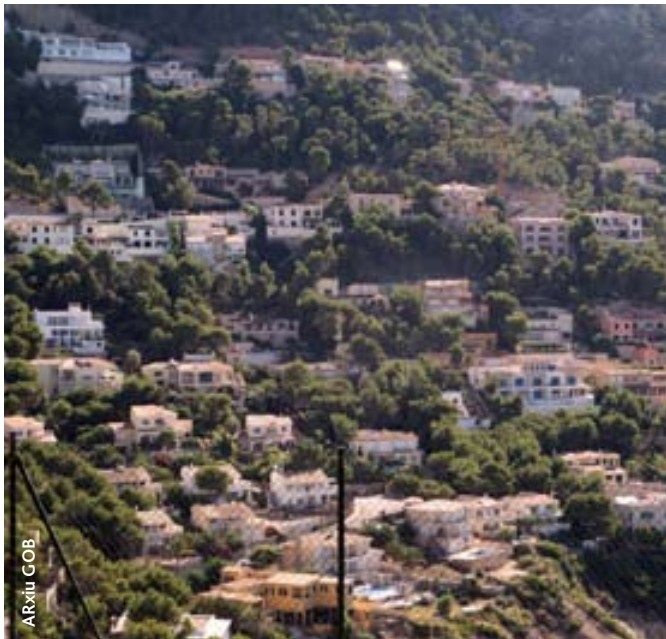
Vista de les edificacions a Cala Llamp (Andratx)

A partir de 1996, arran de la reforma del Codi penal, el nostre Grup va incrementar les denúncies penals, especialment les urbanístiques. Són els casos de construcció de xalets a Felanitx, Puigpunyent o Petra, construcció de camins (Escorca, Felanitx), abocaments de runa i fems (Palma i Lluçmajor), abocament d'arena a llocs d'interès comunitari –LIC– (Can Picafort), pedreres (Palma), destrossa d'edificis catalogats (Campanet, Palma), dragatges (Felanitx), entre molts d'altres casos.