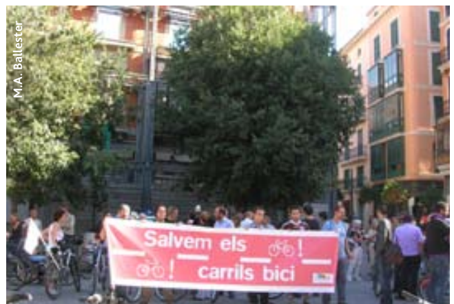
M.A. Ballester Acció de protesta, davant Cort, per la retallada de carrils bici