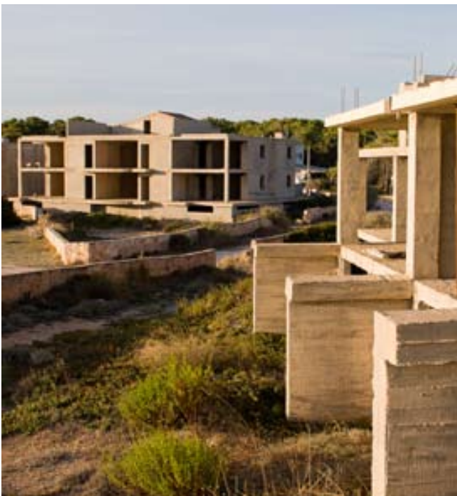
Foto portada: apartaments de ses Covetes (Campos). Autor: Toni Muñoz

El GOB va iniciar, ara fa desset anys, la batalla per aconseguir que es demolissin els 67 apartaments de ses Covetes. Després de nombrosos episodis jurídics, una sentència del Tribunal Suprem ens torna a donar la raó: ELS APARTAMENTS SÓN IL·LEGALS I IL·LEGALITZABLES.