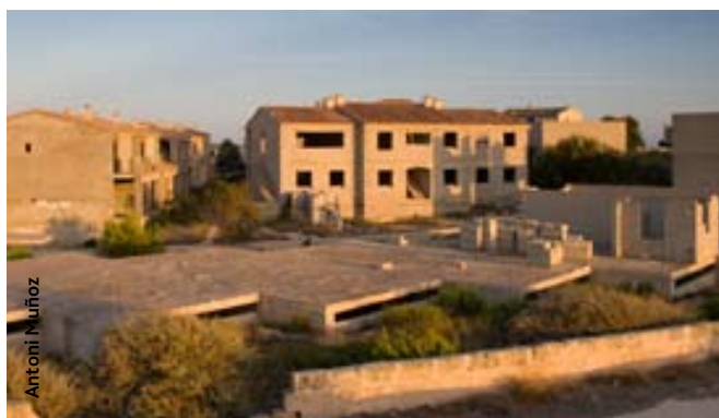
Apartaments de ses Covetes (Campos)

El cas de ses Covetes resulta del tot singular. Aquí, un projecte per edificar 67 apartaments a vorera de mar, just devora la platja des Trenc, va generar un conflicte social i, sobretot, un conflicte jurídic que dura des de fa desset anys i que segurament s'allargarà un parell d'anys més. Es tracta d'un cas emblemàtic que resumeix el procés d'edificació del litoral illenc i que enfrontà els promotors i l'Ajuntament per un cantó i la societat i el GOB per l'altre. Això succeïa l'any 1994.