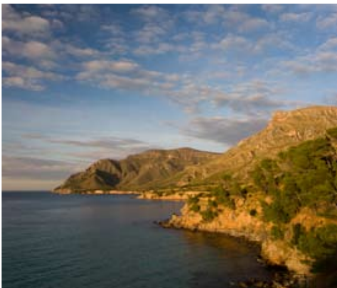
Foto portada: Cap de Ferrutx, Parc Natural de Llevant. Autor: Antoni Muñoz

L'Ecologista: Revista del Grup Balear d'Ornitologia i Defensa de la Naturalesa. Publicació trimestral gratuïta Edició: GOB. Grup Balear d'Ornitologia i Defensa de la Naturalesa. C. de Manuel Sanchis Guarner, 10 - 07004 Palma. www.gobmallorca.com - info@gobmallorca.com